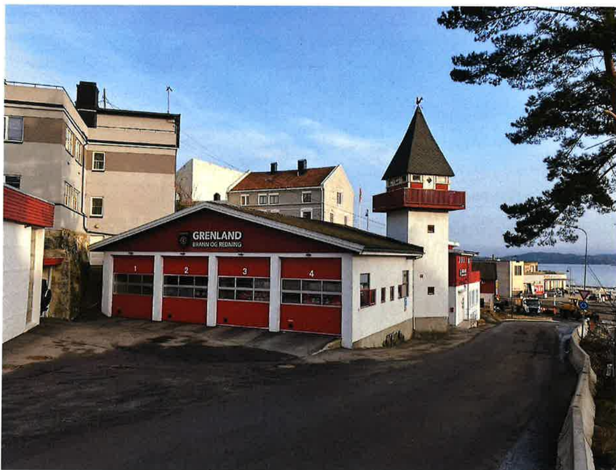
Kragerø brannstasjon.