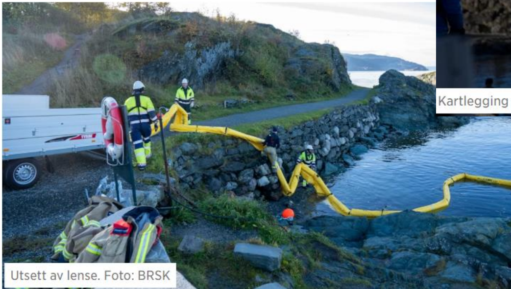
Utsett av lense.