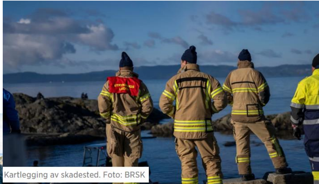
Kartlegging av skadested.